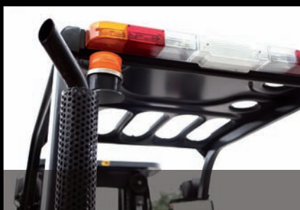
Vertikálny tlmič výfuku