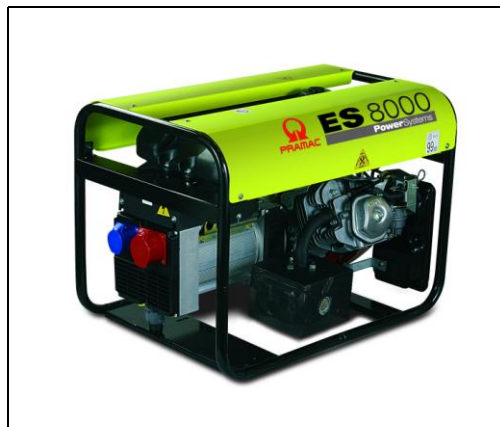
Obrázok je iba informačný