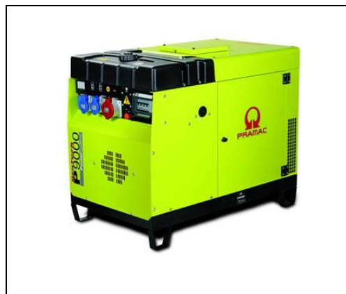
Obrázok je iba informačný